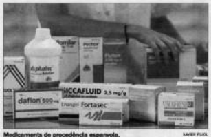
Medicaments de procedència espanyola.

Els farmacèutics estan intranquil·ls. I ho està perquè consideren que en aquests moments Andorra "està proporcionant als farmacèutics dels països veïns unes condicions excepcionals que en cap cas són recíproques", amb referència a la normativa espanyola i francesa, que no permet una obertura indiscriminada