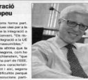
El Regle de l'any 2009 del Consell General va aprovar la modificació parcial de la Llei 1/2009 de l'any 1, a proposta de la Comissió Permanent de l'Unió Financera del Blanqueig, el Govern va presentar al Consell una primera proposta de modificació legislativa d'aquesta Llei a partir de la queixa rebuda del Monexco, del Govern pel que fa a la complexitat de les normes que regulen aquestes matèries i que incloïen aspectes més relacionats amb el blanqueig de capitals, com ara, a títol d'exemple, in-