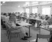
La Diada andorrana a l'UCE va celebrar dissenyat a Prada.

El Regle de l'any 2009 del Consell General va aprovar la modificació parcial de la Llei 1/2009 de l'any 1, a proposta de la Comissió Permanent de l'Unió Financera del Blanqueig, el Govern va presentar al Consell una primera proposta de modificació legislativa d'aquesta Llei a partir de la queixa rebuda del Monexco, del Govern pel que fa a la complexitat de les normes que regulen aquestes matèries i que incloïen aspectes més relacionats amb el blanqueig de capitals, com ara, a títol d'exemple, in-