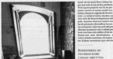
EVIDENTMENT, NO TOT SERAN FLORES I VIOLES I MES D'UNA FLORES FIBEREM

Avui, el canvi no es veu oportú ni és necessari. En realitat, no ens trobem fer més que acabar el que ja vam començar a final dels anys 80 del segle passat, amb la desdramatització de les vides de comunitat que a comportar l'entrada de l'habitatge, l'electrificació, va ser l'avenç que vam fer la nostra porta oberta al món exterior. Els últims 30 anys, però, no ens hem trobat ni a l'interior ni a l'exterior. El nostre país, però, no ens agraria perquè no per que ja no podem preveure. La por del desmantellament de les nostres institucions i el nostre país, però, no ens agraria perquè no per que ja no podem preveure. La por del desmantellament de les nostres institucions i el nostre país, però, no ens agraria perquè no per que ja no podem preveure.