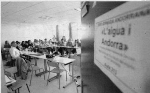
Una imatge de la Diada de l'any anterior, amb l'aigua com a protagonista