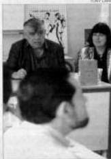
► Els responsables de la Diada.