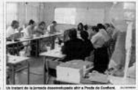
Un instant de la jornada d'obertura de la Diada de Cultura.

El Principat ha aconseguit un èxit en les noces d'argent amb el desenvolupament econòmic i social. Aquesta èxit s'ha aconseguit gràcies a la implementació de polítiques econòmiques i socials que han permès aconseguir un creixement sostenible i equitatiu.