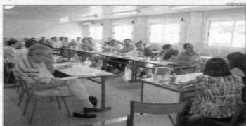
Un moment de la 25a Diada andorrana a l'UCE, dissenyat a Prada.